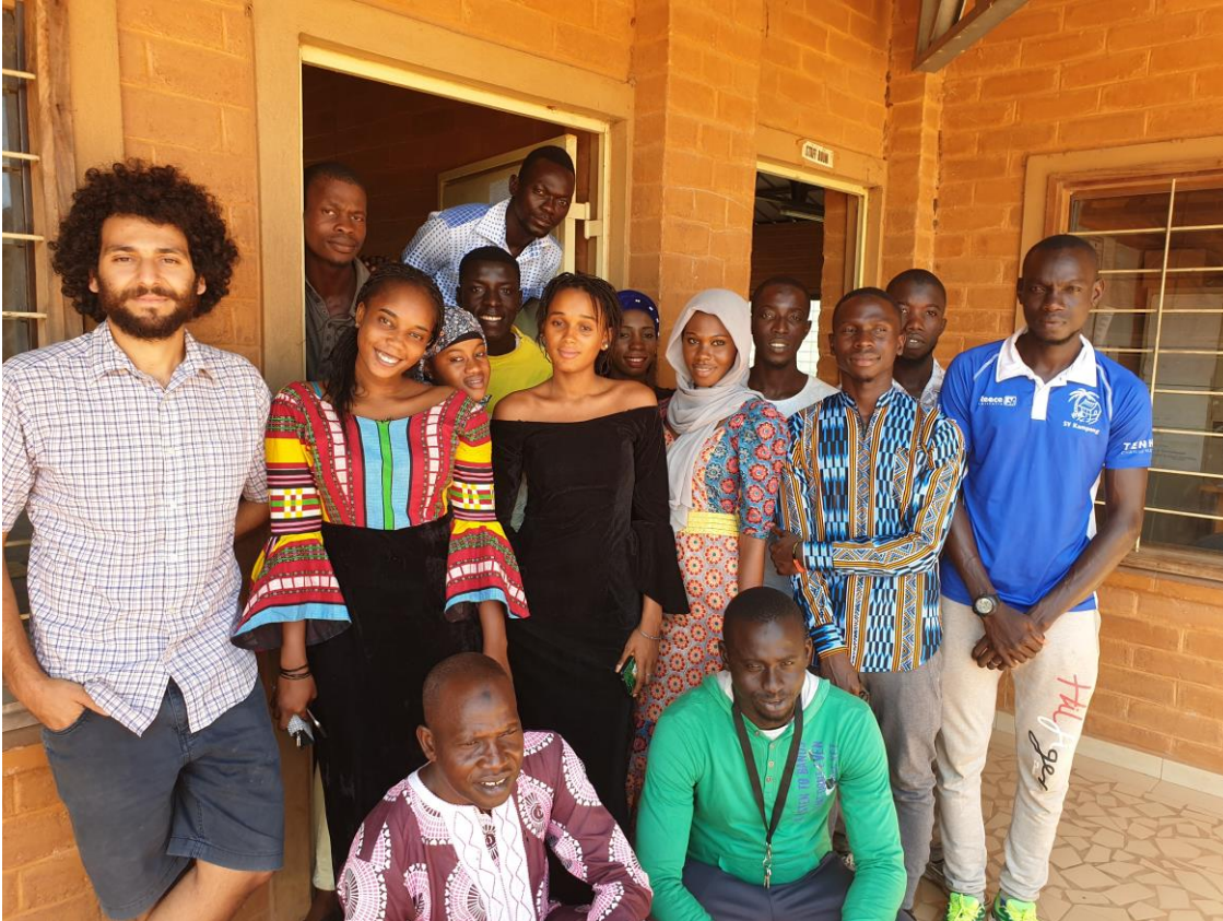
Alle onderwijzers van de basisschool in Tumani Tenda.